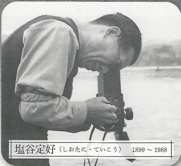
塩谷定好 (しおたに・ていこう) 1899 ~ 1988